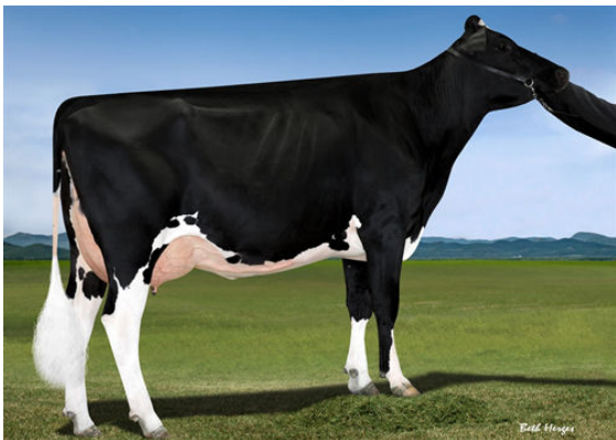
FAIRMONT TUFFENUFF RIDGE GRANDDAM